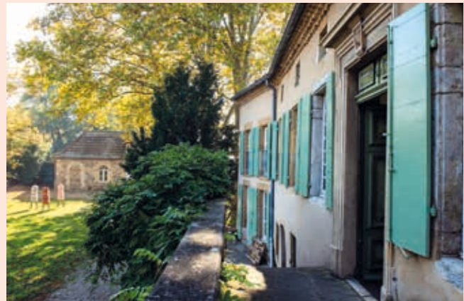
Moly-Sabata en 2021.