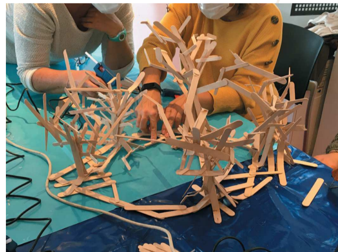
Réalisation d'arbres en bâtonnets de bois. Photo d'Ève Feugier, 2021

Un mois plus tard, en novembre, les premiers élèves sont venus découvrir l'exposition Amazonie[s], forêt-monde et Écorcée de Simon Augade. La visite guidée a été suivie