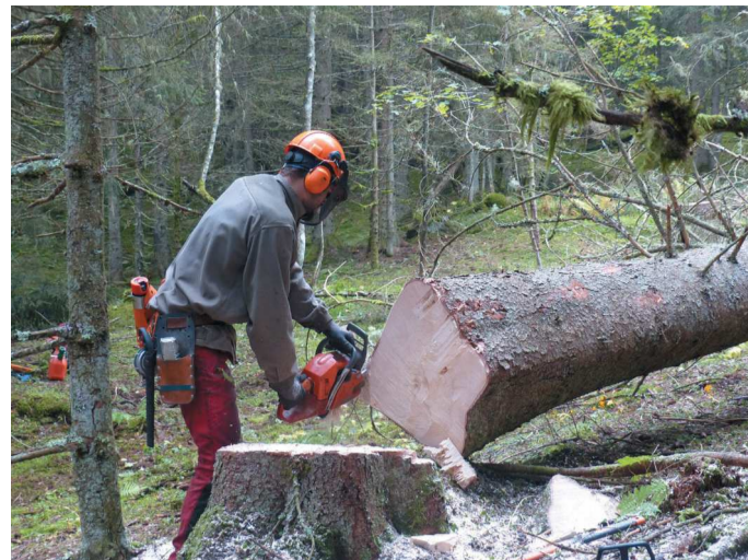
Bucheronnage dans l'espace naturel des Écouves, Vercors.

Les ressources naturelles de l'Amazonie sont, de longue date, utilisées par les peuples autochtones. Mais avec la colonisation, l'équilibre écologique est renversé : à la fin du 19 e siècle, l'hévéa est surexploité en raison de l'essor de l'industrie automobile et de ses besoins en caoutchouc. Puis, au cours du 20 e siècle, l'agrobusiness, l'industrie minière et l'hydroélectricité, contribuent à un processus de déforestation massive en contournant le cadre légal.