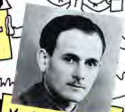
Musée de la Résistance et de la Déportation de l'Isère GRENOBLE