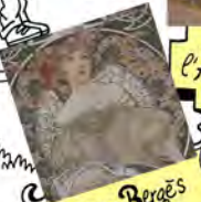
Maison Bergès VILLARD-BONNOT