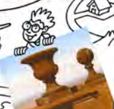
Musée Hébert LA TRONCHE