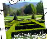
Musée de la Révolution française DOMAINE DE VIZILLE