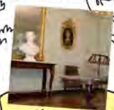
Musée Hector-Berlioz LA CÔTE-SAINT-ANDRÉ