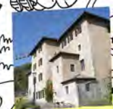
Musée dauphinois GRENOBLE