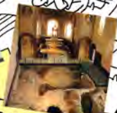
Musée archéologique Saint-Laurent GRENOBLE