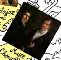
Musée Champollion VIF (2020) (L20)