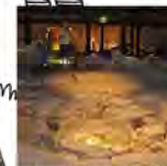
Musée de l'ancien Evêché GRENOBLE