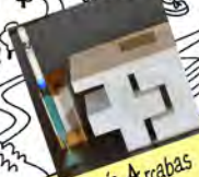
Musée Arcabas en Chartreuse SAINT-HUBERT