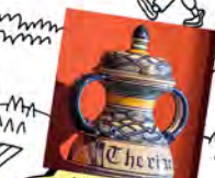
Musée de Saint-Antoine l'Abbaye