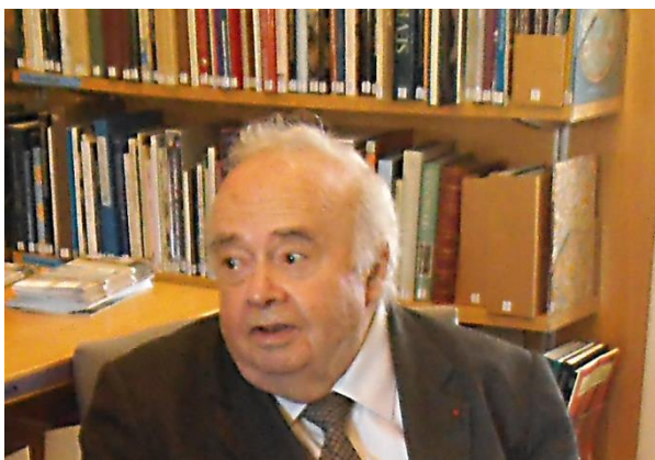
Michel Vovelle, au Centre de ressources Albert Soboul, Musée de la Révolution française (septembre 2014)