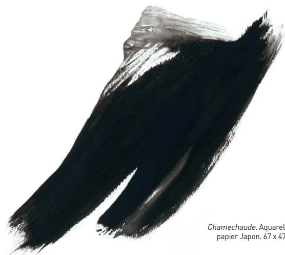
Chamechaude. Aquarelle sur papier Japon. 67 x 47,5 cm