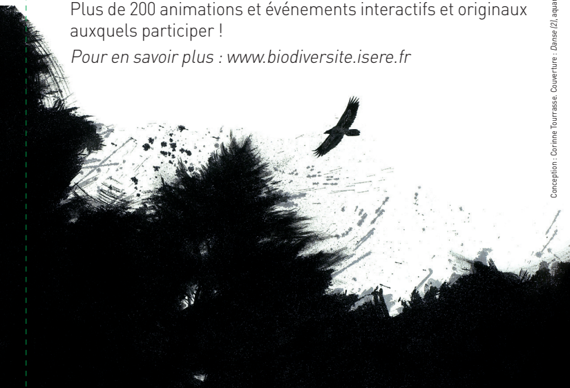
Le gypaète. Encre sur papier Japon marouflé sur toile. 91 x 115 cm

Pour en savoir plus : www.biodiversite.isere.fr