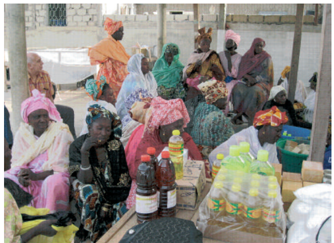
13 - Tontine organisée par le Collectif des femmes pour la lutte contre l'émigration clandestine. Ces femmes se battent pour que les jeunes de Thiaroye ne risquent plus leur vie pour rallier l'Europe. Thiaroye, Sénégal, 2008.