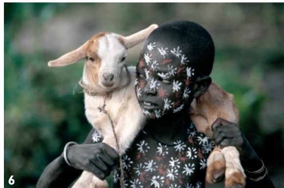
6, 7 et 8 - Suri, habitants de la vallée de l'Omo Éthiopie