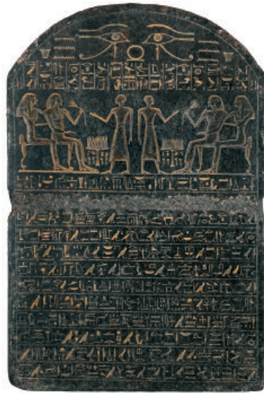
2 - Stèle funéraire du Vizir Ouser Granit gris, provenant d'une tombe de Cheikh Abd el-Gournah, XVIII e dynastie (XV e siècle avant l'ère chrétienne), coll. Musée de Grenoble.