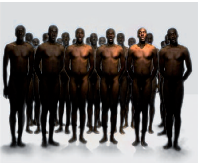
10 - Hymne à nous Vidéo de Moidja Kitenge Banza, 2009