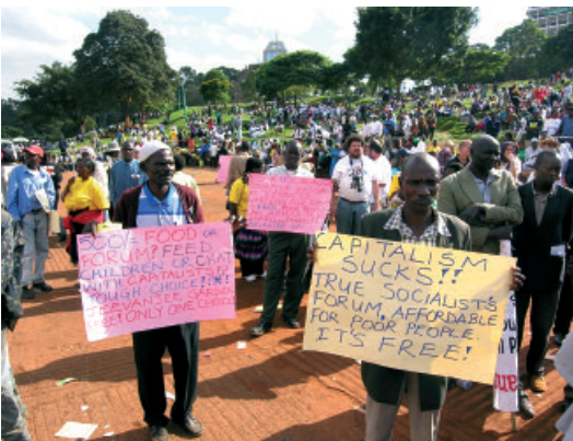
11 - Forum social mondial Nairobi, Kenya, 2007