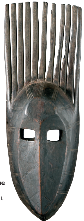
12 - Masque Ntomo Bamana, Mali.