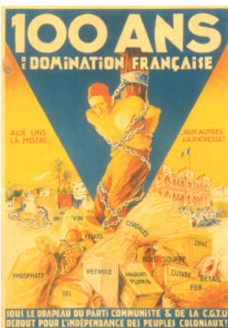
5 - Affiche du Parti communiste français et de la Confédération générale du travail unitaire contre la colonisation, 1930