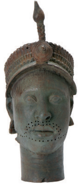
3 - Tête d'un roi d'Ifé Nigéria, XII e - XIV e siècle. Fac-similé du British Museum