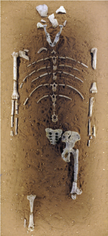
1 - Lucy Hadar (Ethiopie), trois millions deux cent mille ans, moulage des 52 os retrouvés de son squelette.