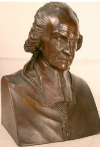
4 - Abbé Henri Grégoire (1750-1831) Buste réalisé par le fondeur Ferdinand Barbedienne, d'après l'œuvre de David d'Angers, cuivre, Seconde moitié du XIX e siècle coll. Musée lorrain