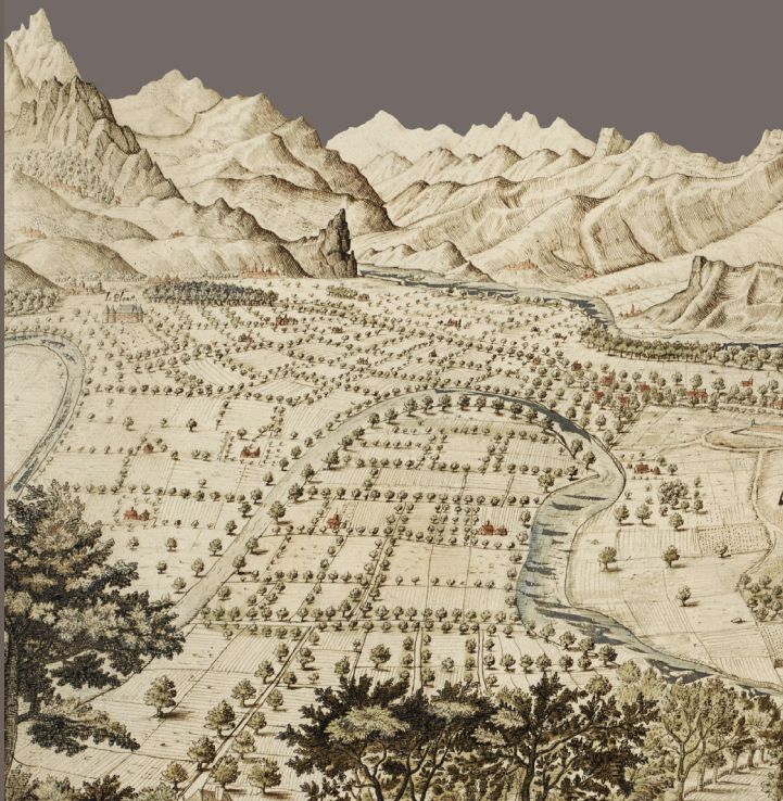
Paysage de Grenoble, Jean de Belins, © The British Library, Londres