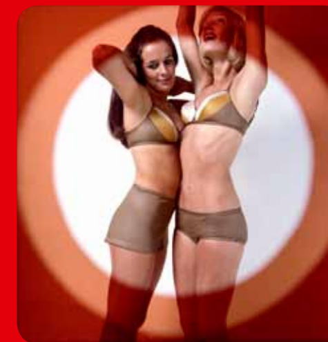
Parures Lou 1973.

Tarif : 3,80 € - Gratuit pour les moins de 12 ans