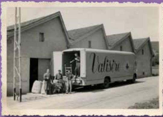
Usine Valisère à Varacieux Livraison des matières premières. Vers 1960.