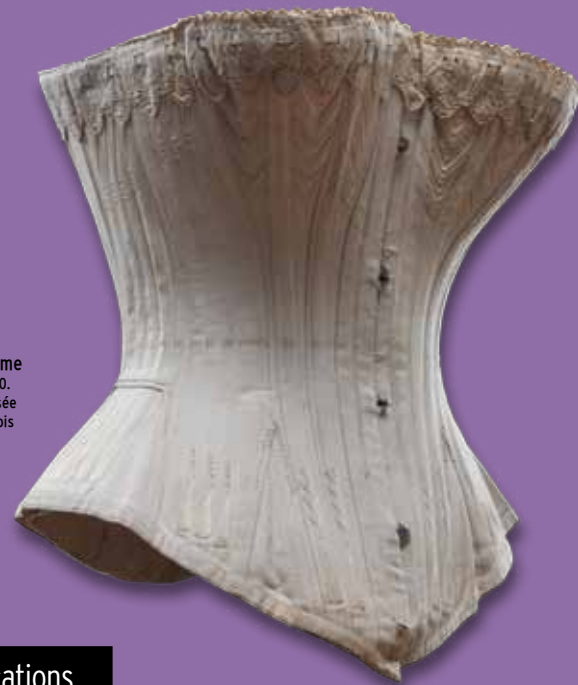
Corset de femme Vers 1860. Coll. Musée dauphinois

L'industrialisation de la lingerie. Les usines et les machines perfectionnées produisent les dessous de millions de femmes. Les textiles dépendent de la chimie qui inventent des tissus qui sèchent vite et ne se repassent pas. Pour être dans le vent on a la fibre moderne ! À Grenoble une gigantesque usine, La Viscose, produit dès 1927 un fil révolutionnaire qui sera tissé partout en France et notamment chez Valisère.