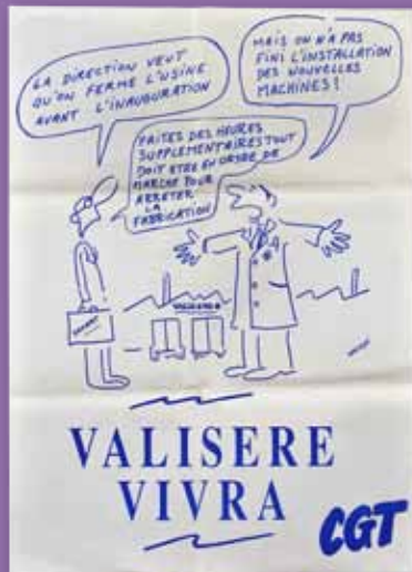
Valisère vivra Wolinski © Musée de la Viscose

Où sont les femmes d'aujourd'hui ? La lingerie est-elle affaire de séduction, de confort ou de conformité à des modèles ? Un micro-trottoir, des chansons, les "portraits culottés" de Chloé Prigent opposent, en fin d'exposition, leurs témoignages aux publicités contemporaines.