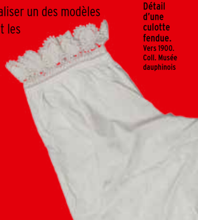
Détail d'une culotte fendue. Vers 1900. Coll. Musée dauphinois

Tarif de l'atelier : 11,40 € Inscriptions au 04 57 58 89 01