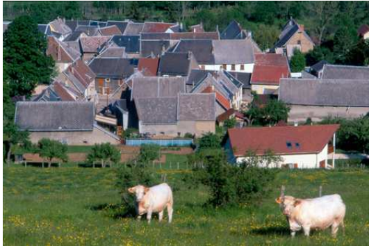
1. Notre-Dame-de-Vaulx