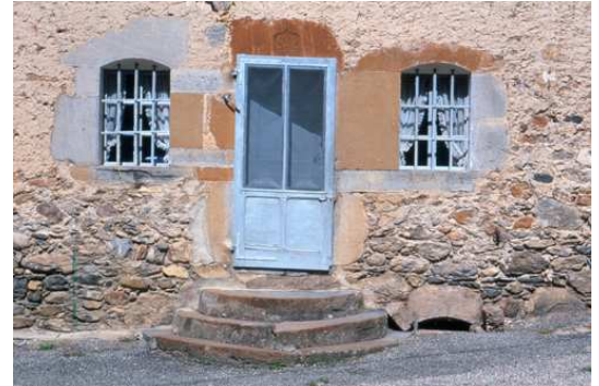
2. La Draye, Le Périer