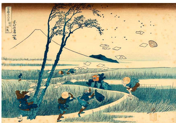
Le coup de vent dans les rizières, Hokusai © École française d'Extrême-Orient, Paris

Une exposition qui invite à pénétrer l'âme nippone dans ses visions et ses représentations de la nature et des paysages.