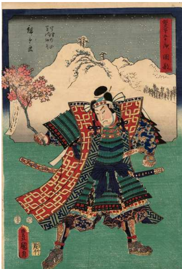
Okabe, Kunisada et Hiroshige

L'exposition rassemble cent trente-deux estampes, issues de collections publiques et privées : une série de trente-six planches conservées au Musée-muséum départemental des Hautes-Alpes à Gap, un album des Trente-six du vues du mont Fuji et des estampes provenant de différents fonds. Ces œuvres sont exceptionnelles. On notera la mise en avant de mitate-e , un genre de l' ukyo-e qui demeure méconnu en France et qui met en écho portrait et paysage de façon comparative ou parodique, invitant le visiteur à pénétrer les tréfonds de la culture nippone.