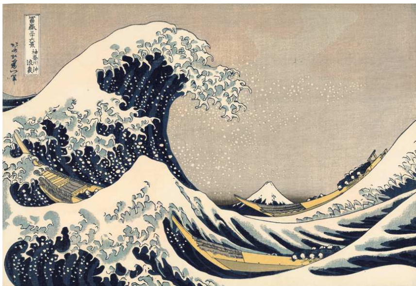
Sous la vague au large de Kanagawa, Hokusai

Cette mise en espace a été réalisée par Corinne Tourrasse, graphiste.