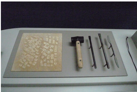
Domaine de Vizille