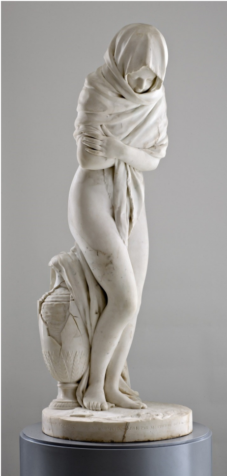
Jean-Antoine Houdon, L'Hiver , (dite aussi La Frileuse ), 1783, moulage en résine chargée de poudre de marbre, H.145 cm ; L. 57cm ; P. 64 cm

Jean-Antoine Houdon, Voltaire , 1780-1790 moulage en résine chargée de poudre de marbre et patiné H. 145 cm ; L. 57 cm ; P. 64 cm