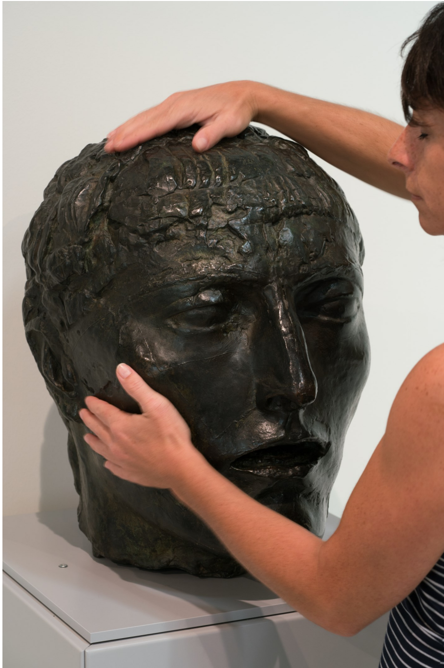
Émile Antoine Bourdelle, Tête de l'Éloquence, vers 1913-1923), bronze, H. 49 cm ; L. 33 cm ; P. 43 cm