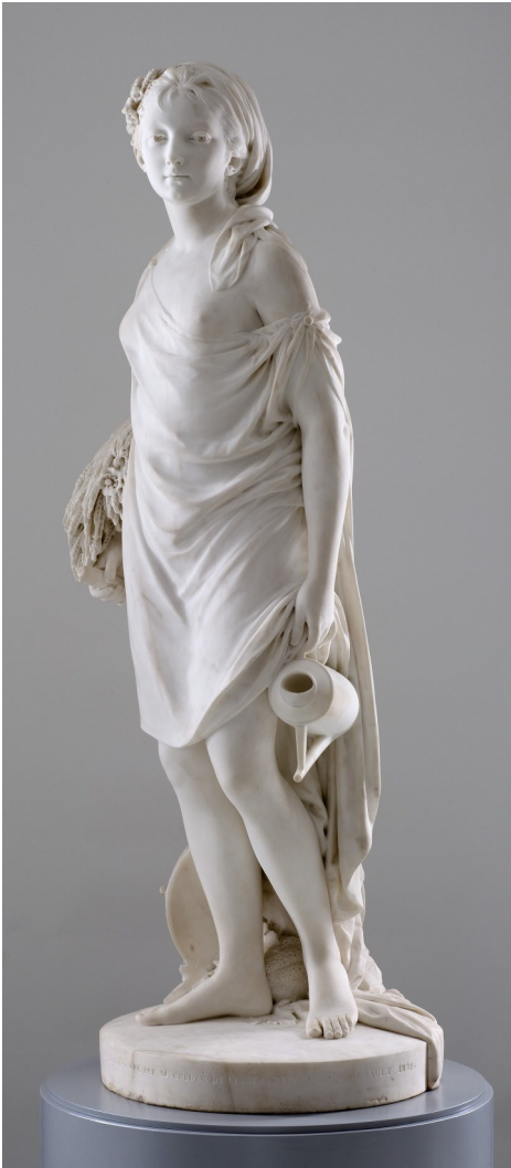
Jean-Antoine Houdon, L'Été , 1785, moulage en résine chargée de poudre de marbre, H.155 cm ; L. 56 cm ; P. 49 cm

La section « galerie de sculptures à toucher », permet de se mouvoir au milieu d'une galerie de moulages de sculptures que le public peut toucher.