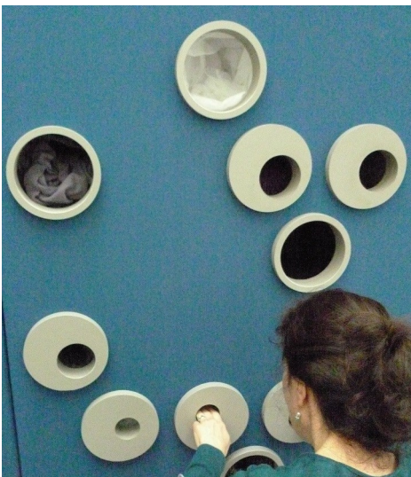
Domaine de Vizille