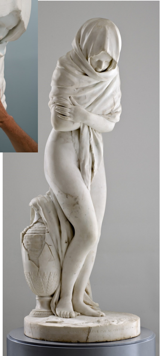
Jean-Antoine Houdon, L'Hiver , (dite aussi La Frileuse ), 1783, moulage en résine chargée de poudre de marbre, H.145 cm ; L. 57cm ; P. 64 cm