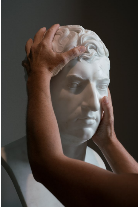
Anonyme, Portrait de François-Xavier Fabre , vers 1830, moulage en résine chargée de poudre de marbre, sans socle : H. 62 cm ; l. 27 cm ; P. 27,5 cm

L'espace introductif, « voir autrement », est conçu comme un espace d'éveil sensoriel, où le public est mis en condition de découverte tactile. Plusieurs dispositifs lui apprennent à toucher comme on apprend à regarder.