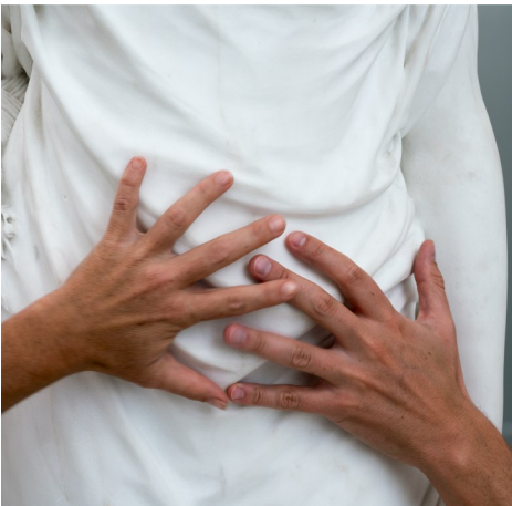
Jean-Antoine Houdon, L'Été, 1785, moulage en résine chargée de poudre de marbre, H.155 cm ; L. 56 cm ; P. 49 cm

Conçue par le musée Fabre de Montpellier Méditerranée Métropole en partenariat avec le musée du Louvre, cette exposition a déjà connu un franc succès ! Fort de cette expérience auprès de ses visiteurs, le musée Fabre a souhaité en faire bénéficier d'autres publics en mettant ce dispositif culturel à disposition du Musée de la Révolution française.