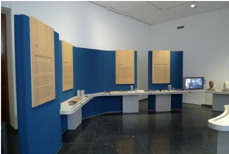
Domaine de Vizille

L'espace multi-sensoriel, « l'atelier du sculpteur », fait découvrir les outils, les matériaux et les techniques du sculpteur, du modelage de la terre à la taille du marbre en passant par la fonte du bronze. L'ouïe, l'odorat, le toucher et la vue sont les vecteurs privilégiés pour une immersion complète dans cet univers.