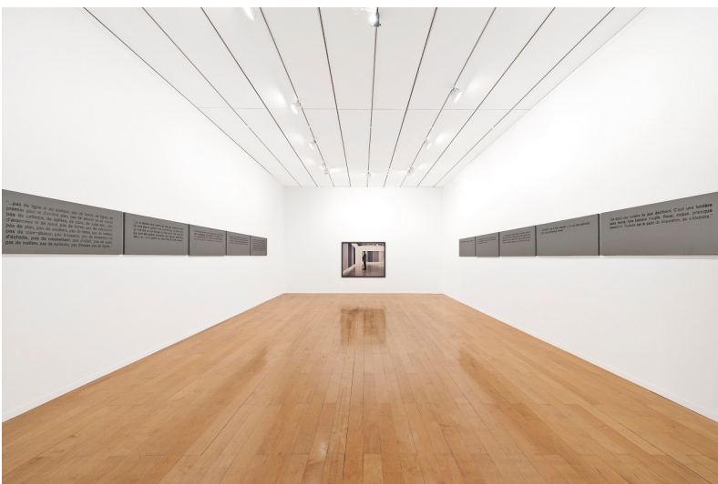
Sophie Calle, Paris (Ile-de-France, France), 1953 La couleur aveugle 1991 Installation | 10 peintures, 1 photographie Musée d'Art Contemporain de Lyon © Adagp, Paris - Photo : Blaise Adilon

La photographie semble éliminer la couleur pour ne conserver que le gris, alors que le gris pour les peintres est la somme de toutes les couleurs. L'œuvre a été créée à l'occasion de la première Biennale de Lyon et s'intitulait alors L'expérience du monochrome la couleur seule .