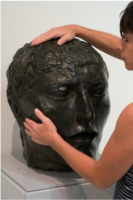
Emile Antoine Bourdelle, Tête de l'Eloquence, vers 1913-1923), bronze, H. 49 cm ; L. 33 cm ; P. 43 cm