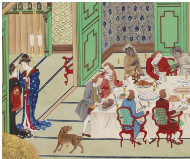
Banquet hollandais pour le réveillon de Noël (fac-similé)

Gravure de Jacques Callot