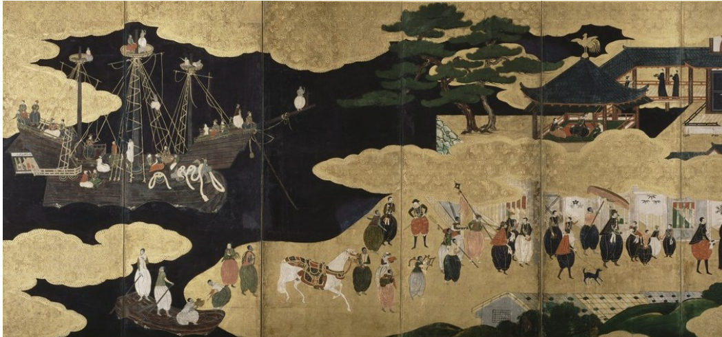
Treillis en bois couvert de papier, feuille d'or, détrempe polychromée, soie, laque, dorure de cuivre. Coll. Museu Nacional de Arte Antiga – Lisbonne

Fac-similé de paravents, illustrant l'arrivée des Occidentaux au Japon, accueillent le visiteur.