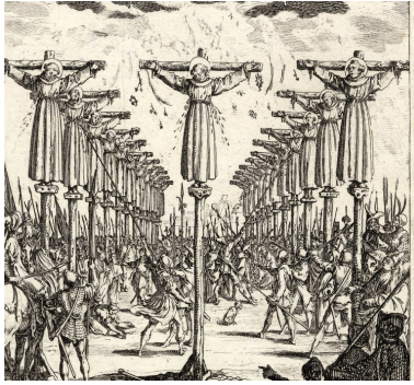
Les Martyrs du Japon 1627 - 1628

Gravure de Jacques Callot Médiathèque de Metz