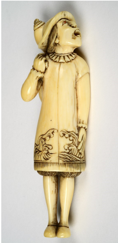
Statuette d'un Hollandais Époque Edo (1603-1868) Ivoire

Dédié aux sociétés alpines, le Musée dauphinois s'intéresse également aux cultures d'ailleurs pour affirmer son attachement à défendre la diversité.