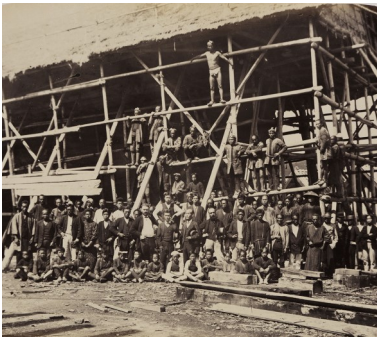
Chantier de construction à l'arsenal naval de Yokosuka Vers 1878.