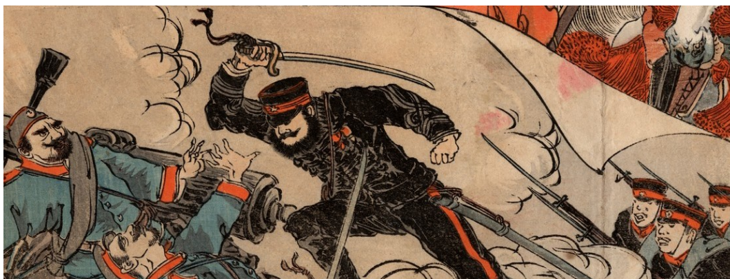
Bataille de Tashihchiao, Chine, juillet 1904 Estampe. Coll. particulière

Au cœur de l'exposition, estampes et photographies reproduites sur vingt-cinq lampions éclairés, illustrent les échanges avec les Occidentaux.