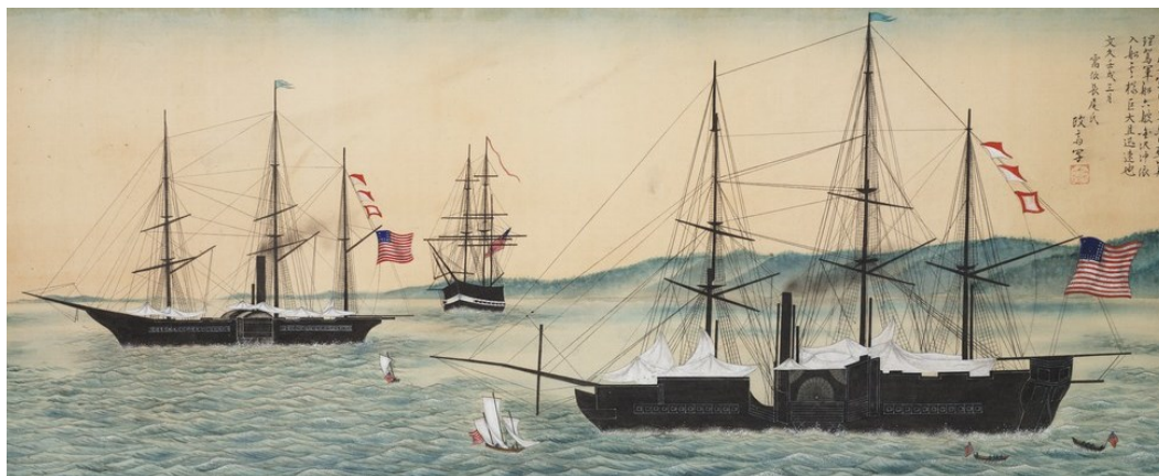
Arrivée des « vaisseaux noirs » du commodore Perry en 1854 Fac-similé. Vers 1862-1880. Peinture. Coll. Bibliothèque universitaire Yale, New Haven

Débouchant d'un couloir symbolisant la fermeture du Japon à l'Occident, le public découvre le foisonnement artistique du pays du Soleil-Levant à l'instar des Occidentaux au mitan du 19 e siècle.