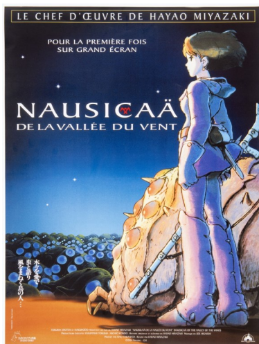
Nausicaä. De la vallée du vent Affiche Coll. privée