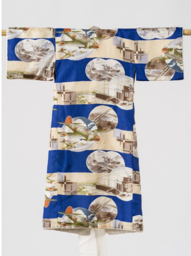
Kimono en soie de jeune garçon aux motifs de propagande