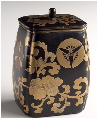
Boîte pour cendres d'encens

1797. Attribué à Ishizaki Yūshi Peinture sur soie Coll. Bibliothèque nationale de France