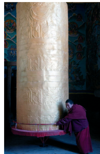
Jeune moine tournant un moulin à prières au monastère Tsuglhakhang de l'école Kagyü, Riwoche, Kham, Région autonome du Tibet (République populaire de Chine), mai 2009