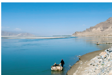
Pêcheurs dans leur coracle (bateau rond en peau de yak), rive nord du Yarlung Tsangpo, Ü, Région autonome du Tibet (République populaire de Chine), mai 2009