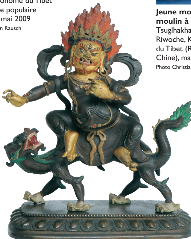
Jambhala juché sur son dragon

2 de moitié du XVIII e siècle - XIX e siècle, bronze