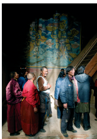
Fidèles, à l'ouverture des portes du monastère Tsuglhakhang de l'école Kagyü, Riwoche, Kham, Région autonome du Tibet (République populaire de Chine), mai 2009