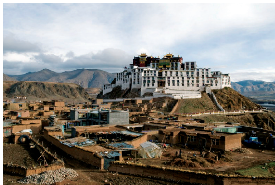
Monastère de Sok Tsanden , dans le Kham, Région autonome du Tibet (République populaire de Chine), mai 2009