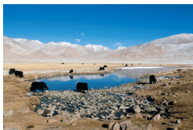
Yaks au pâturage , rives du lac salé Tsokar, haut plateau du Changthang, Ladakh (Inde), altitude : 4 000 m., janvier 2005