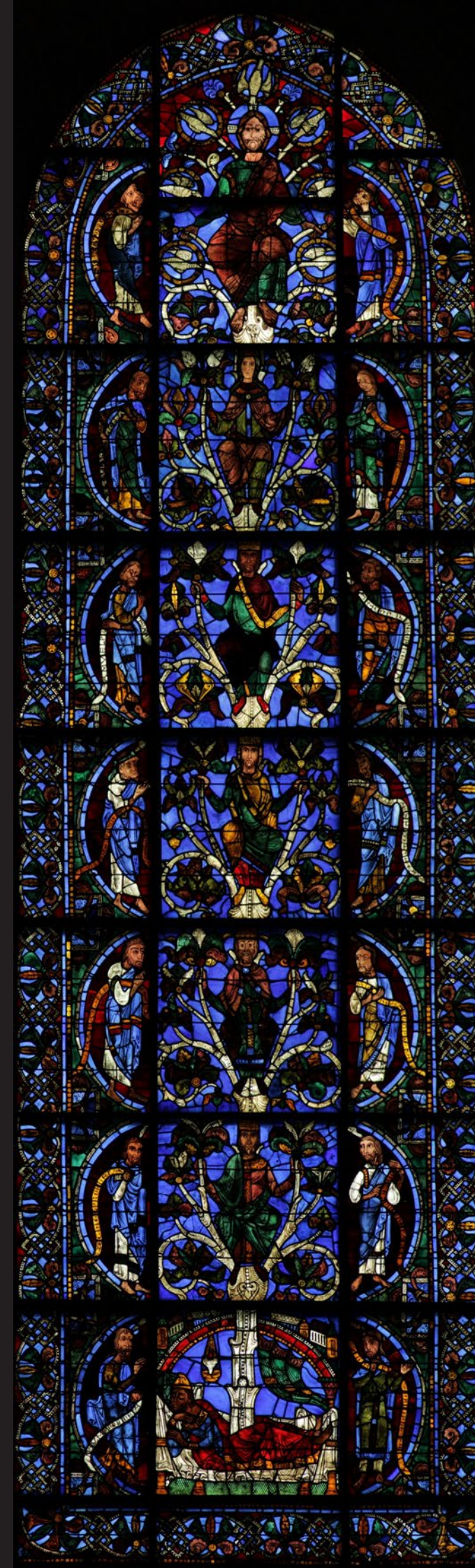
Arbre de Jessé, Verrière N°49 Cathédrale de Chartres