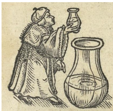
Detail du frontispice, Der gantzen Artzenei gemeyner Inhalt , Johann Dryander, 1542. Paris, BiU Santé, cote 9020.

Sylvain DEMARTHE – UMR ArTeHis Université de Bourgogne