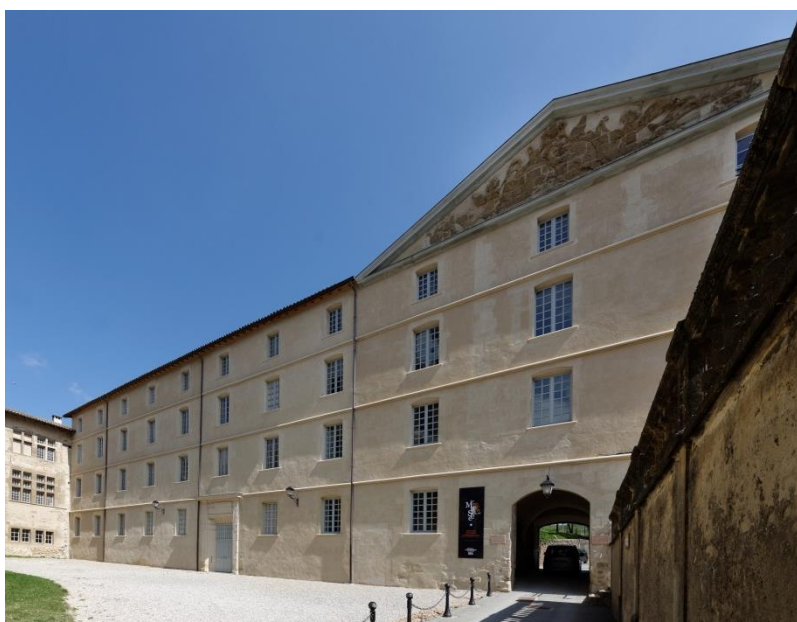
Façade du musée – bâtiment du Noviciat

Plus de 1300 m 2 sont ouverts à la visite sur plusieurs sites avec une muséographie renouvelée et interactive. Chaque saison, des expositions temporaires, spectacles et concerts sont proposés en résonance avec l'histoire du site. Un programme spécifique à destination du public scolaire est proposé. Une exposition temporaire événement est présentée au public chaque année durant la période estivale.