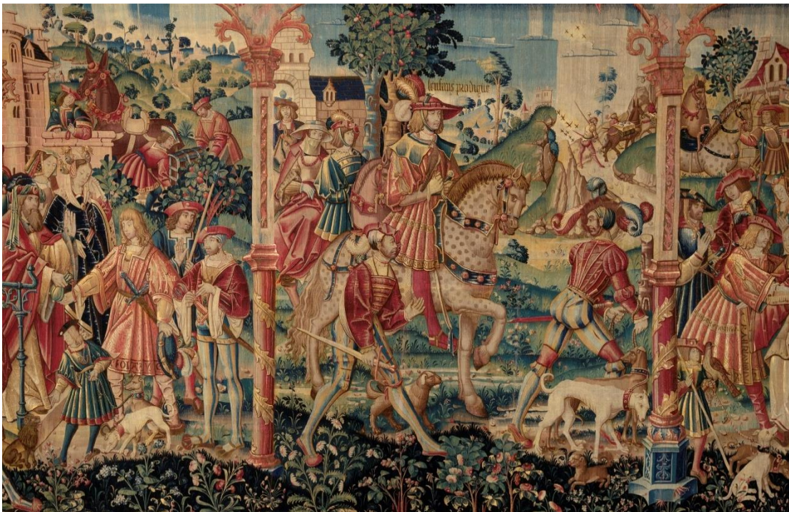
Détail - Le départ de l'Enfant prodigue , Pays-Bas du sud, vers 1510-1520.

Créée au début du XVI e siècle aux Pays-Bas du Sud (Tournai ?), la tapisserie témoigne du savoir-faire virtuose de ce Moyen Âge finissant. On retrouve ainsi les millefleurs et la symbolique médiévale dans la multitude des détails de ce chef d'œuvre – à découvrir en Gigapixel au sein de l'exposition.