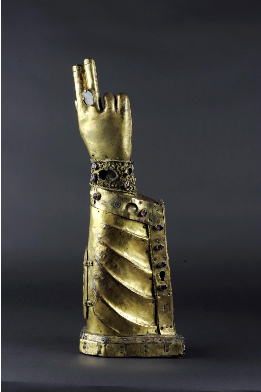
Bras-reliquaire , XIVe siècle. Cuivre, bois, quartz et améthyste. Inv. 18121. Toulouse, musée Paul Dupuy