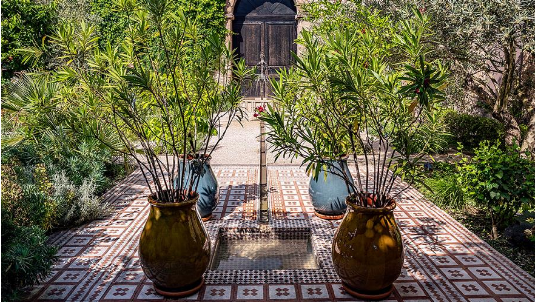
© Cnossos / Musée de Saint-Antoine-l'Abbaye, 2018