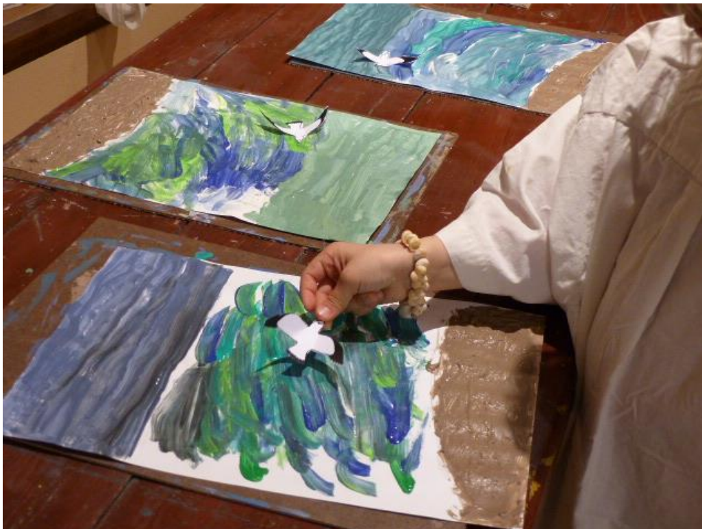
© Département de l'Isère /Musée de Saint-Antoine-l'Abbaye