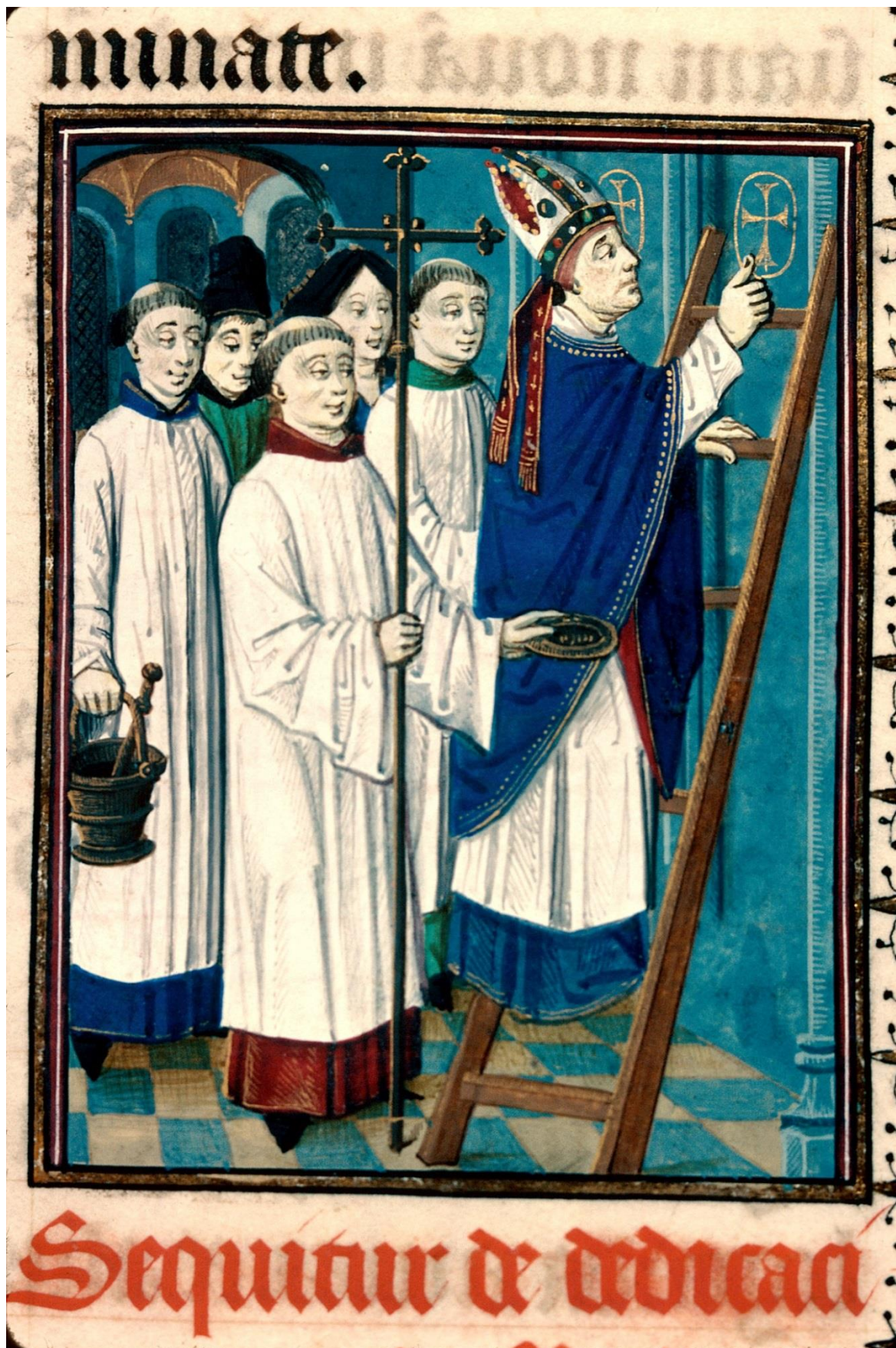
Dédicace d'une église , détail d'une enluminure.

Pontifical de Charles de Neufchâtel , avant 1498. Manuscrit sur parchemin, cote Ms. 116 – folio 103. Bibliothèque municipale de Besançon.