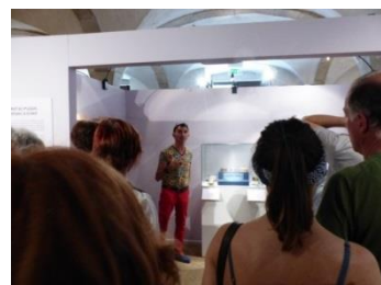
© Département de l'Isère /Musée de Saint-Antoine-l'Abbaye

>> Salle voûtée des Grandes écuries. Dans la limite des places disponibles. A partir de 10 ans. Durée : 1h.