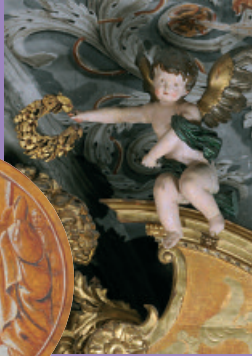
François de Sales reçu par le pape Clément VIII ; médaillon dans la chapelle dite "du saint".