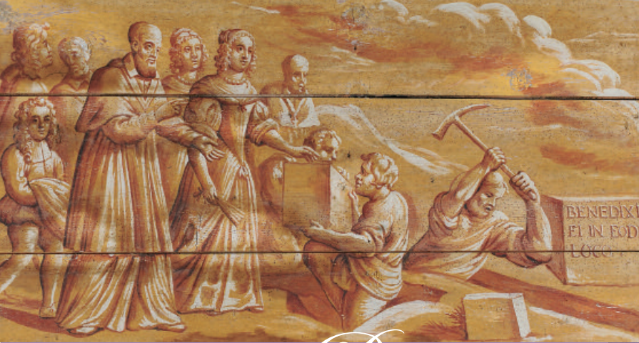
Pose de la première pierre par Christine de France et François de Sales en 1619. Décor peint sous la tribune de la chapelle.

En surplomb de la ville, à l'abri du tumulte et des tracasseries de la vie urbaine, se dresse le monastère de Sainte-Marie d'en-Haut, quatrième fondation de l'ordre de la Visitation. Né au XVII e siècle de la rencontre de François de Sales (1567-1622) et de Jeanne de Chantal (1572-1641), cet ordre monastique féminin est l'expression du renouveau du catholicisme après une longue période de guerres de religion.