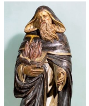
Statue en bois polychrome, XVIIe - XVIIIe s. - Musée de Saint-Antoine-l'Abbaye.