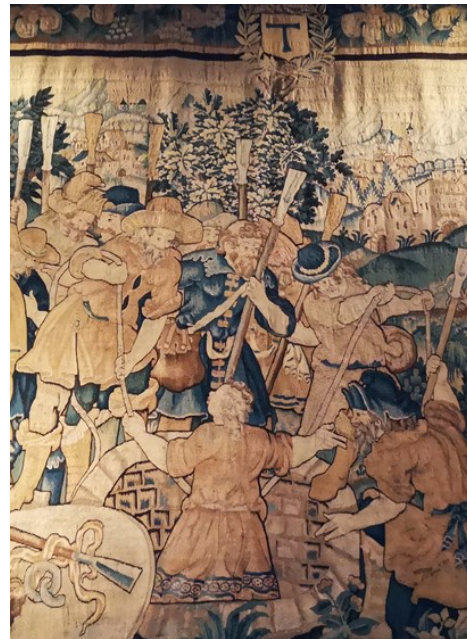
Tapisserie d'Aubusson (détail), Léonard de Vialleys, 1623 - Musée de Saint-Antoine-l'Abbaye.

Derrière le sursaut illusoire conféré par les arts transparait déjà le crépuscule d'un ordre qui disparaît en 1777, absorbé par l'Ordre de Malte.