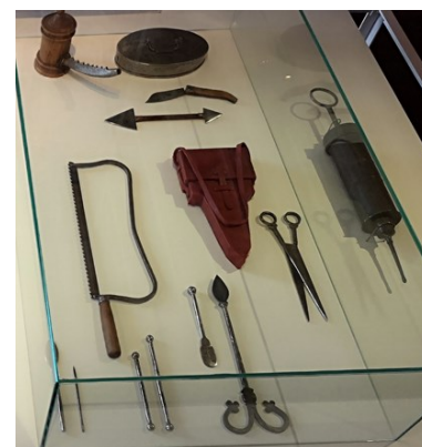
Outils de chirurgie, parcours permanent - Musée de Saint-Antoine-l'Abbaye

nés. Cette opération rudimentaire s'effectue sans anesthésie, on utilise seulement des éponges somnifères imbibées d'un mélange de plantes narcotiques, comme la mandragore, pour apaiser le malade. La suture étant encore inconnue en Europe, il faut cautériser les plaies à l'aide d'un outil de métal chauffé à blanc pour arrêter l'hémorragie.