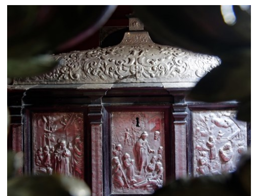
Châsse reliquaire de saint Antoine, bois de poirier et feuille d'argent, 1648 - Eglise abbatiale.

Les reliques sont conservées dans le chœur de l'église abbatiale, à l'abri d'une châsse reliquaire réalisée au XVII e siècle.