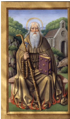
Heures de René d'Anjou, XVe s.

« Saint guérisseur, Antoine jouit d'une très grande popularité ».