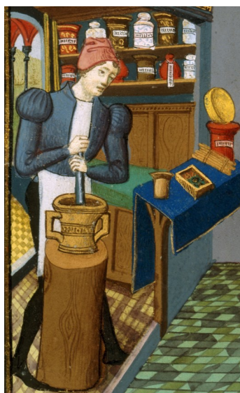
Antidotarius, Bernardi di gordonio XV e s.,manuscrit enluminé, Paris BnF, cote ms. latin 6966 folio 154 verso.

Bénéficiant d'un statut particulier, le saint Vinage est bien plus qu'un breuvage thérapeutique. Mis au contact des reliques d'Antoine, il revêt une dimension sacrée. Préparé au cours d'un rituel lors des Fêtes de l'Ascension, il est administré exclusivement aux malades frappés du mal des Ardents dès le diagnostic posé, à leur arrivée dans les hôpitaux de l'abbaye.