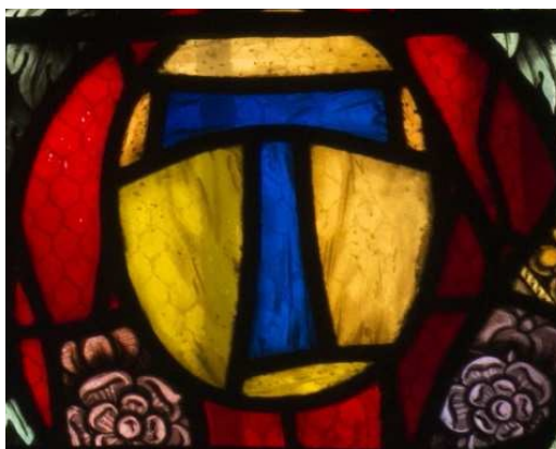
Vitrail de la chapelle Notre-Dame de consolation (détail) - Eglise abbatiale de Saint-Antoine-l'Abbaye.

* Exposition permanente Chroniques d'une abbaye - Musée de Saint-Antoine-l'Abbaye.