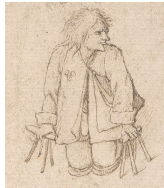
Estropiés et gueux (détail), Jérôme Bosch, XVI e siècle, Albertina Museum, Vienne, Autriche.

« A l'origine du mal, un champignon parasite du seigle : l'ergot ».