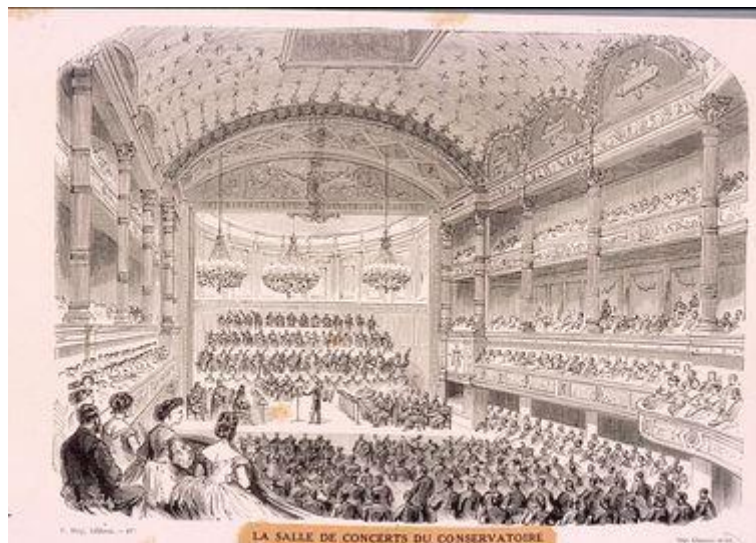
La salle de concerts du conservatoire