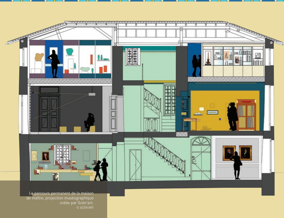
Le parcours permanent de la maison de maître, projection muséographique créée par Scèn'art.