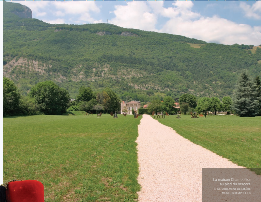
La maison Champollion au pied du Vercors.