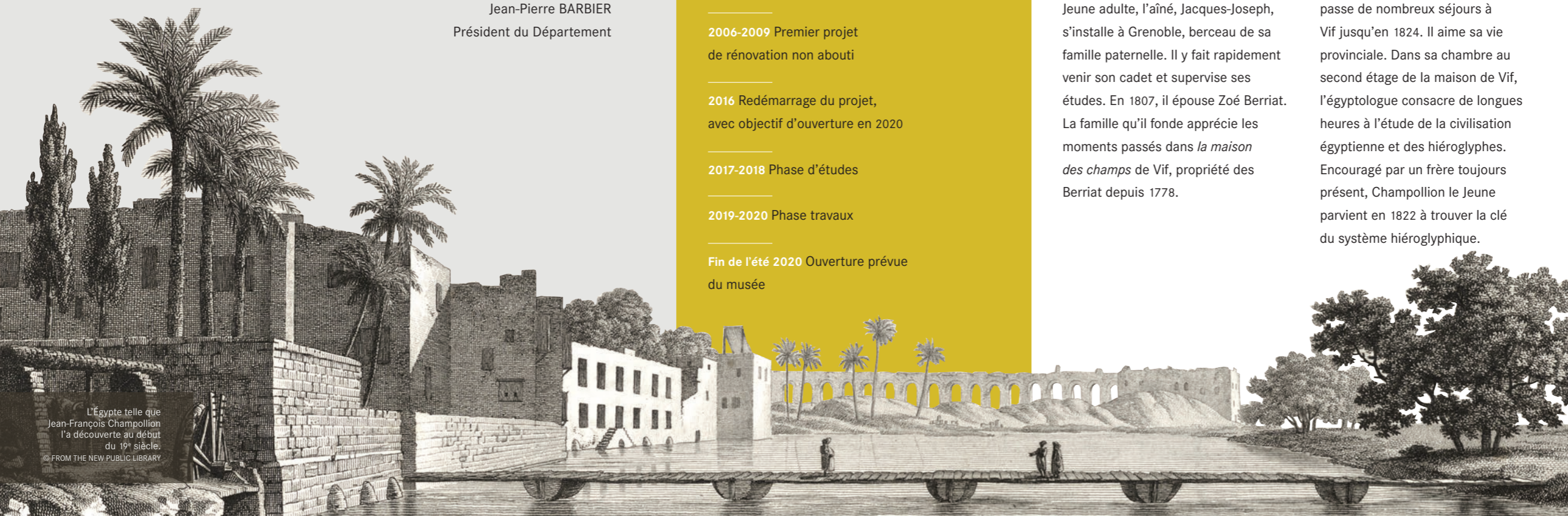
L'Égypte telle que Jean-François Champollion l'a découverte au début du 19 e siècle.