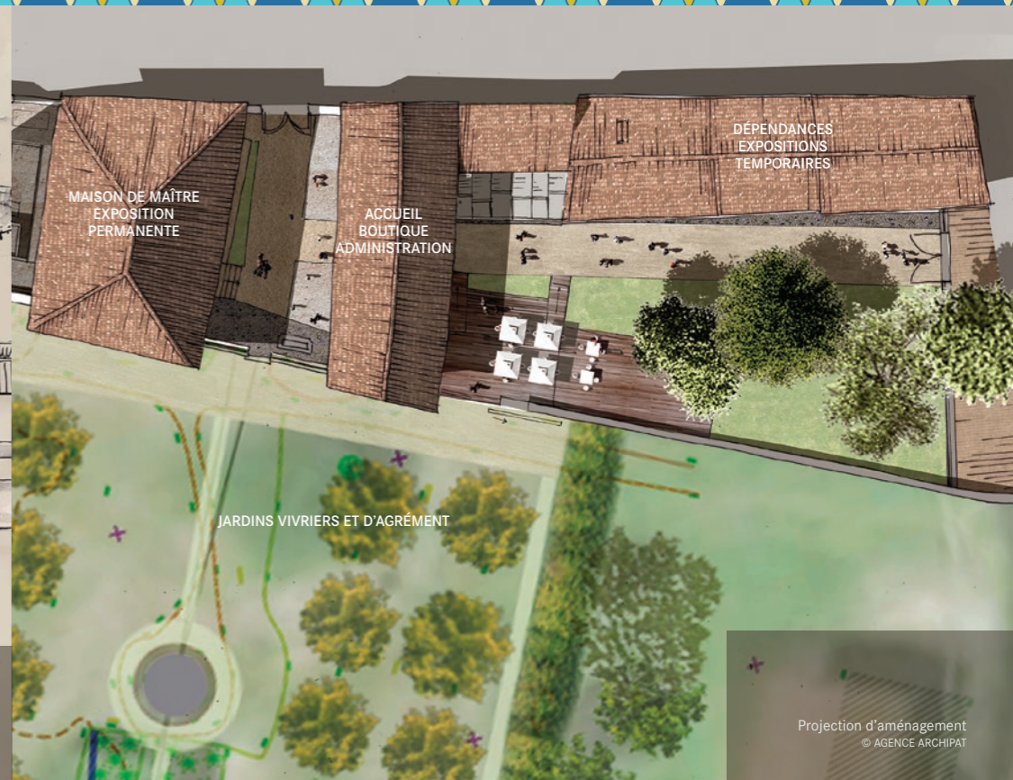
Projection d'aménagement © AGENCE ARCHIPAT