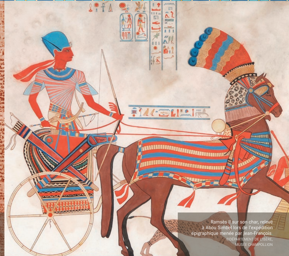
Ramsès II sur son char, relevé à Abou Simbel lors de l'expédition épigraphique menée par Jean-François