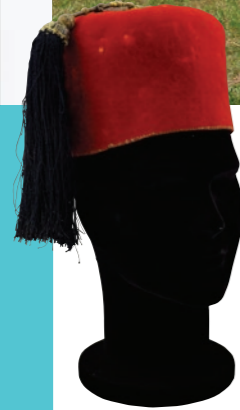
Chéchia de feutre précieusement conservée par Jean-François Champollion comme souvenir de son voyage en Égypte

La collectivité investit 6,2 M d'euros dans le projet de rénovation. L'État et la Ville de Vif participent au montage financier.