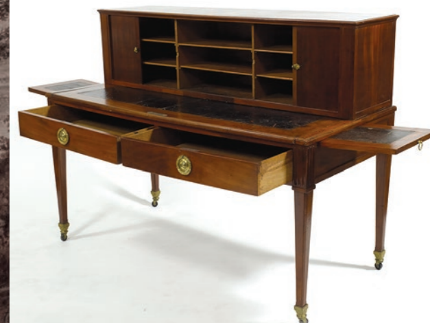
Le bureau en acajou, premier témoin des années de recherche et du déchiffrement.