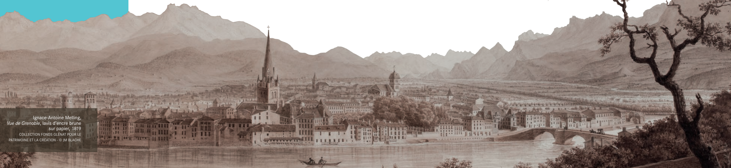
Ignace-Antoine Melling, Vue de Grenoble , lavis d'encre brune sur papier, 1819 COLLECTION FONDS GLENAT POUR LE PATRIMOINE ET LA CRÉATION - © JM BLACHE

à Joseph Fourier, secondé par Jacques-Joseph. Les archives familiales classées historiques en 1997, sont conservées aux Archives départementales de l'Isère. Elles constituent l'un des plus beaux fonds intellectuel, historique et scientifique de la première moitié du 19 e siècle. Cet ensemble de 60 volumes de correspondance fait l'objet depuis 2010 d'un inventaire pièce à pièce.