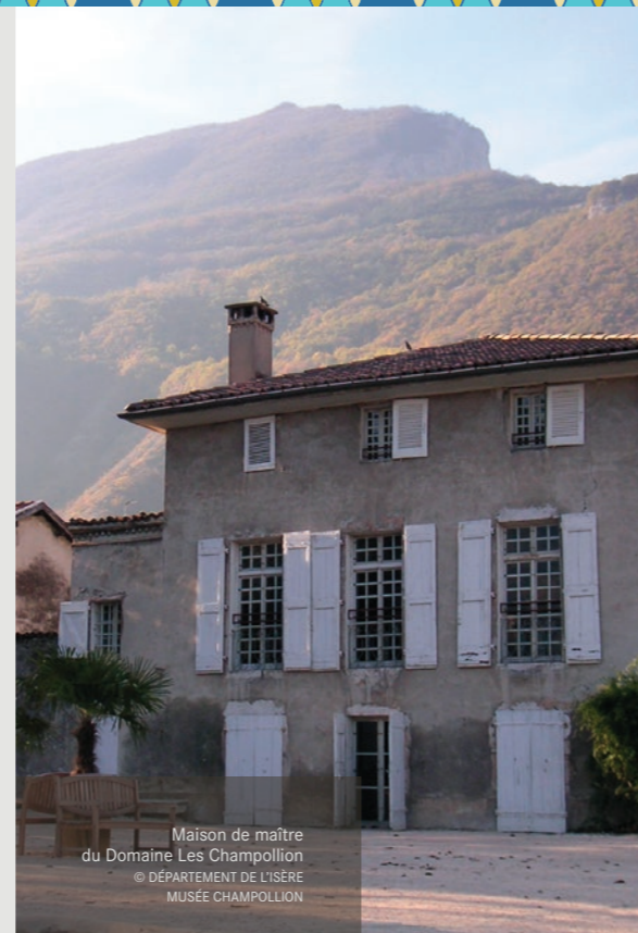
Maison de maître du Domaine Les Champollion