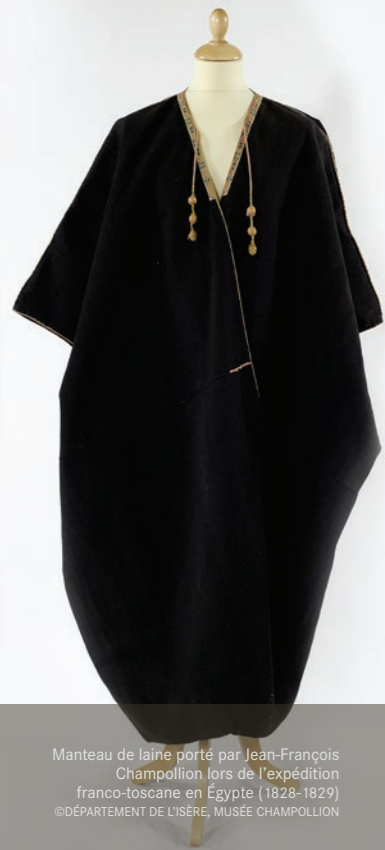
Manteau de laine porté par Jean-François Champollion lors de l'expédition franco-toscane en Égypte (1828-1829)