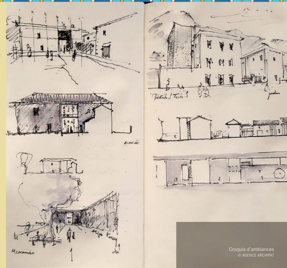
Croquis d'ambiances © AGENCE ARCHIPAT