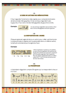
Le livret-jeu et le mémo fournis.