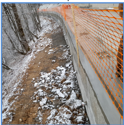
Mur de soutènement réalisé en 2021 (1ère phase)

L'étroitesse de la route, dans cette zone nécessite la mise en place de restrictions de circulation adaptées pour permettre la réalisation des travaux tout en garantissant la sécurité des usagers et des ouvriers, avec notamment la mise en place d'une déviation locale par la voie communale des Cottaves (voir détail au verso).