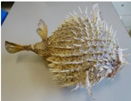
Diodon, Musée de Saint-Antoine-l'Abbaye.

A la fin du Moyen Âge, l'ordre des Antonins est riche et puissant ; les abbés reçoivent les princes, s'intéressent aux sciences et aux arts, créent un cabinet de curiosité et deviennent des mécènes ; Je cherche la définition de ce mot :