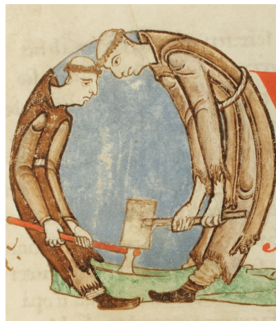
Moines bûcherons, lettrine enluminée, XII e s., Ms 170 f.59 - Bibliothèque municipale de Dijon.