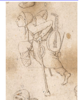
Estropiés et gueux (détail), J.Bosch, XVI e s., Albertina Museum, Vienne, Autriche.

L'abbaye de Saint-Antoine accueille pèlerins et malades en grand nombre. Ceux-ci font des dons qui permettent la construction et l'entretien de l'abbaye et font vivre le Bourg (hôtelleries, auberges, commerces, étuves...). Les religieux hospitaliers contribuent également aux progrès des connaissances en médecine et chirurgie.