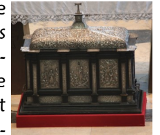
Statue en pierre polychrome, XV e siècle - Musée de Saint-Antoine-l'Abbaye. Châsse reliquaire de saint Antoine, bois de poirier et feuille d'argent, 1648 - Eglise abbatiale.

Les pèlerins affluent à l'abbaye car on attribue aux reliques d'Antoine des pouvoirs miraculeux de guérison tandis que de très nombreux malades sont accueillis et soignés par les hospitaliers dans des hôpitaux situés aux portes de l'abbaye.