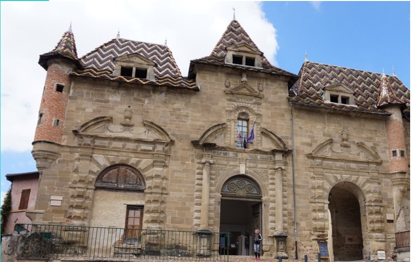
Abbaye de Saint-Antoine, la porterie.

Au Moyen Âge, une abbaye hospitalière au cœur du Bourg de Saint-Antoine