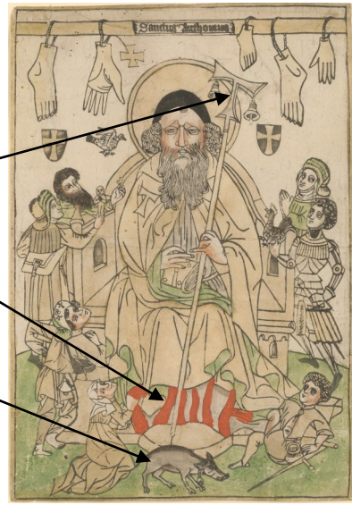
Saint Antoine, gravure sur bois par M. Schongauer, vers 1450 -SGS, Munich.