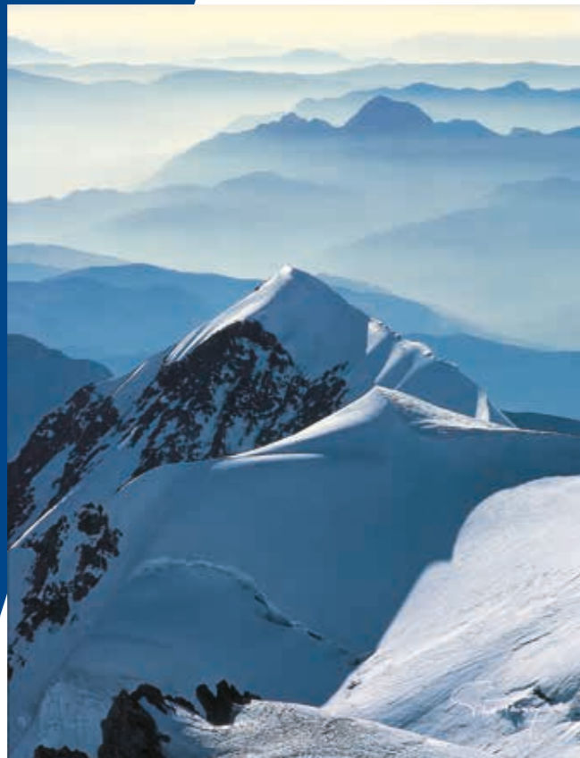
Pierre Tairraz, Les relais de l'infini. L'aiguille de Bionnassay (4 052 m), 1978.

Avec cette exposition, le public découvrira l'œuvre de ces quatre photographes, dont deux sont également cinéastes, lesquels pendant près de cent cinquante années vont sublimer la montagne.