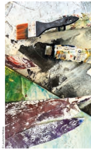
5 € (Tarif 2023 sous réserve de modification en 2024). Durée : 2 h.