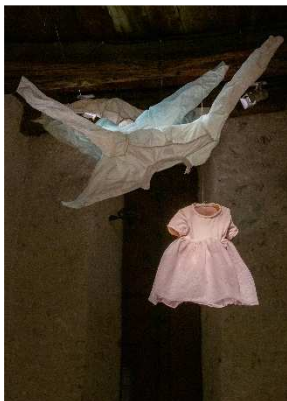
© Département de l'Isère / Musée archéologique Saint- Laurent