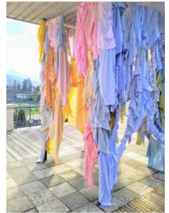
© Kaarina Kaikkonen / Musée Hébert