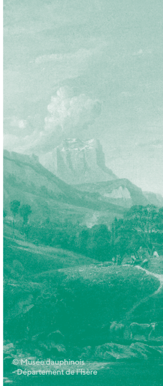
© Musée dauphinois - Département de l'Isère