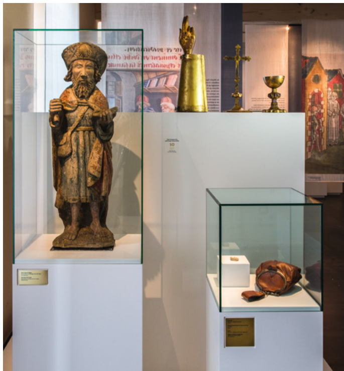
© Fabian da Costa / Musée de Saint-Antoine-l'Abbaye