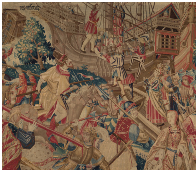
Colyn de Coter (entourage), Bataille et embarquement, XVI e siècle. Cl. 14335.

Du 5 juillet au 8 novembre → Le Noviciat