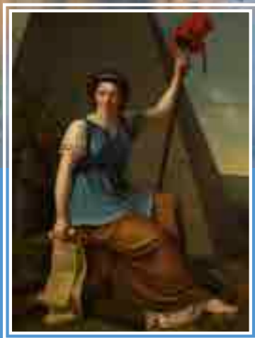
La Liberté, 1794 Nanine Vallain (1767-1815)

Dépôt du Musée du Louvre au Musée de la Révolution française.