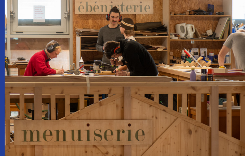
Ateliers des Compagnons du Tour de France, Grenoble, 2026