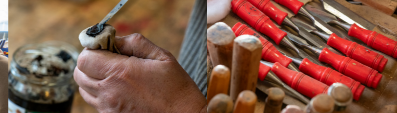
Lionel Chardonnet, ébéniste restaurateur, appliquant une cire au tampon, Grenoble, 2025

Du mardi 6 avril au dimanche 18 avril 2027 Gratuit en accès libre