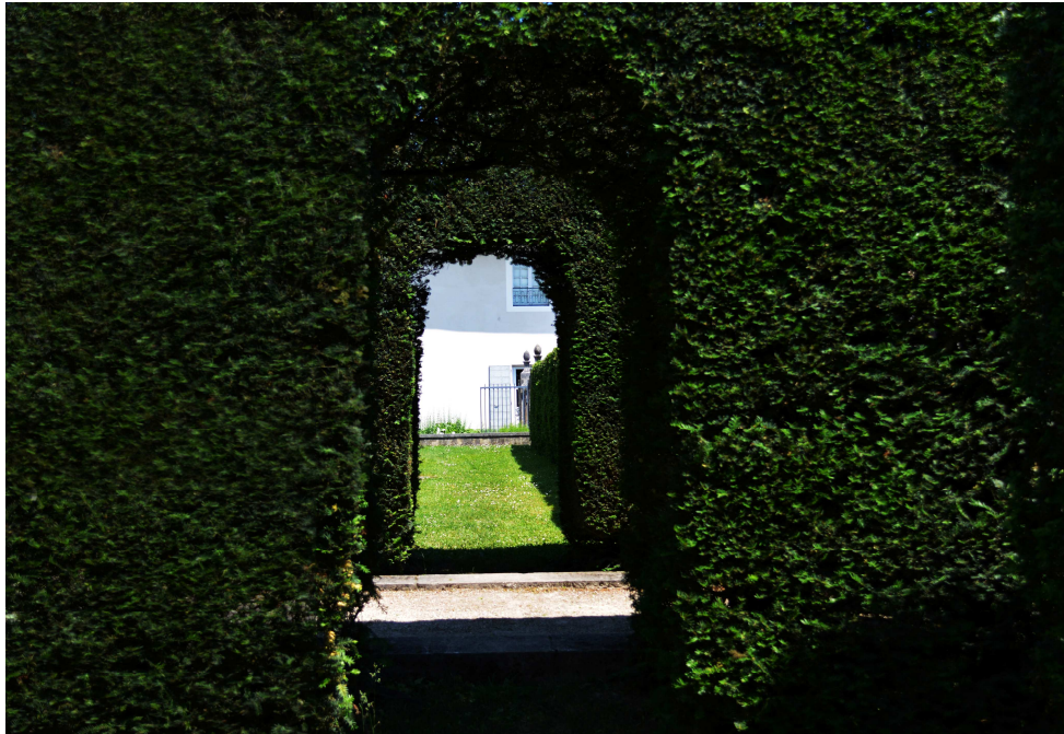
Porte n°2, 2013

Le jardin est pour moi un lieu de rêve ; rêver et faire rêver, variations, couleur, lumière, architecture, porte, passage, espace, ces mots m'inspirent et conduisent mon regard dans la traversée du jardin.