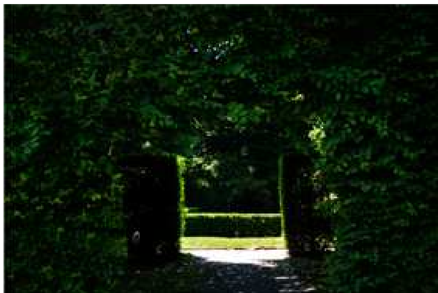
Porte, n°1, 2013

Cabinet des dessins du 11 octobre au 30 décembre 2013 prolongée au 28 février 2014