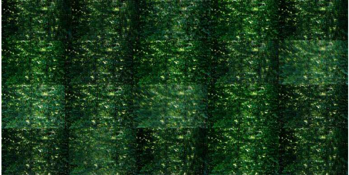
Envert, variation A, 2013

Envert, vient de mon désir d'explorer une fois de plus l'émotion de la couleur, mais aussi les notions de transparence, de lumière, entrant en résonance avec le mot variations.