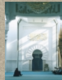
Grande Mosquée Lyon

En vente à l'accueil du Musée Dauphinois