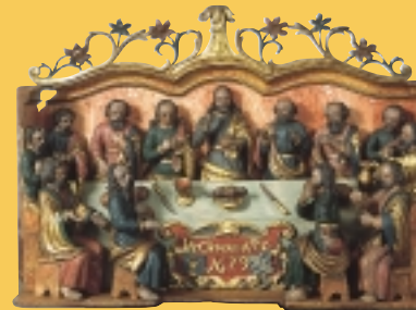
La Cène. Bas-relief, 1679.