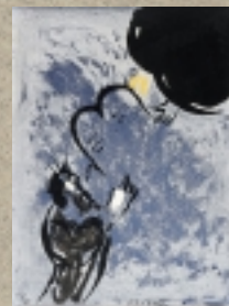
Moïse reçoit les tables de la loi Marc Chagall

et à la MSH-Alpes Campus universitaire de Saint-Martin-d'Hères