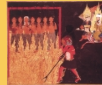
L'Enfer. Miniature turque, XVI e s.

Croyant ou athée, les religions font partie de notre culture et il est difficile d'en ignorer l'histoire. Aucun domaine de la vie publique et privée n'échappe aux références religieuses dont on a souvent perdu le sens. Connait-on encore la signification du Carême, de Pâques, de l'Épiphanie ou de la Chandeleur, ces fêtes qui rythment notre quotidien ?