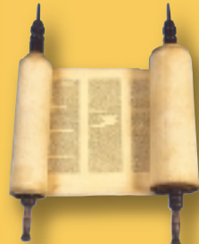
Sefer Torah. Bois et parchemin, XX e s.