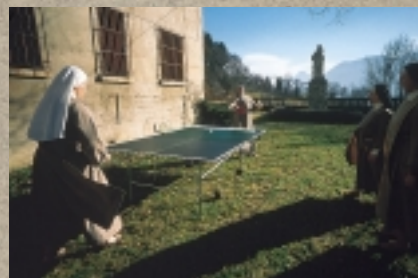
Couvent des Clarisses Chalais, Voreppe