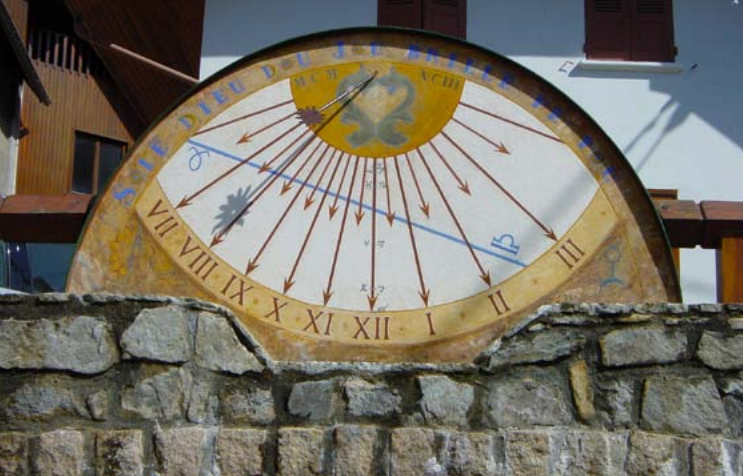
Allemont, création de l'Atelier Tournesol en 1993