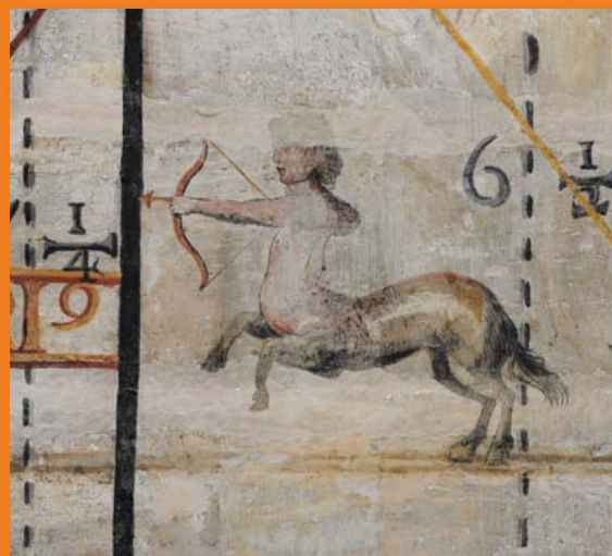
Détail de l'horloge universelle des jésuites, lycée Stendhal (Grenoble), fin XVII e siècle.

Tarif : 3,80 € - Gratuit pour les moins de 12 ans