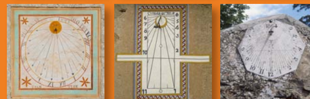
De gauche à droite et de haut en bas : Choranche, Merlas, Chatte, Venosc (1669), Cadran multiface du Musée dauphinois (1793), Aquarelle de T. Schurch, Apprieu, Saint Marcel Bel Accueil, Jarcieu (1864).