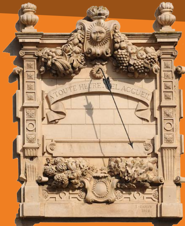
Bas-Dauphiné, cadran bas-relief sculpté en 1908 par L. Camus.