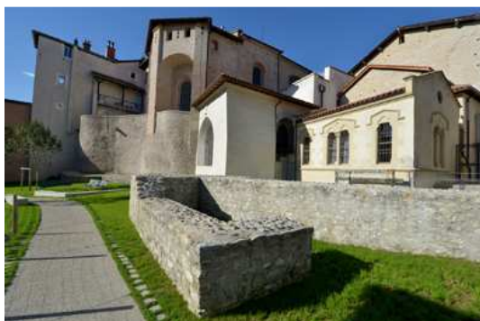
Le Jardin du Musée de l'Ancien Évêché Chevet de la cathédrale Notre-Dame, chapelle de la Vierge et sacristie de l'église Saint-Hugues