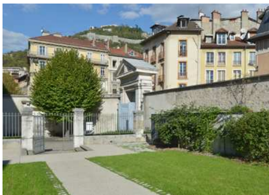
Le Jardin du Musée de l'Ancien Évêché Entrée côté Rue Très-Cloîtres