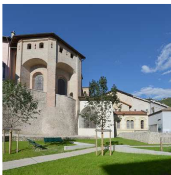
Le chevet de la cathédrale Notre-Dame