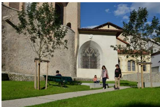
Le Jardin du Musée de l'Ancien Évêché