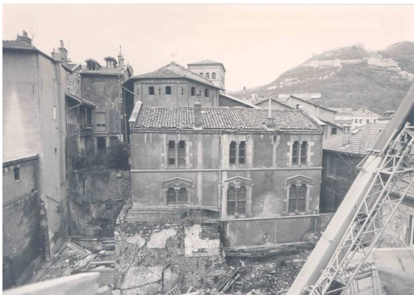
Au premier plan, la sacristie des chanoines avant démolition Au second plan, le sommet du chevet fortifié de la cathédrale

L'ancien jardin des évêques qui a connu de nombreuses transformations est remodelé en un jardin provisoire aménagé le long du musée. Un bâtiment de béton, adossé au mur de clôture au nord, est établi parallèlement à la rue Très-Cloîtres. Il renferme des annexes techniques du tout nouveau musée et une sous-station électrique de Gaz et Électricité de Grenoble (GEG). La salle de cours construite par l'Université est démolie. Il est aussi décidé, au terme d'un long débat, de détruire la sacristie des chanoines qui masque le chevet fortifié de la cathédrale daté du 13 e siècle et qui barre la perspective sur la rue du Fer-à-Cheval. La sacristie de l'église Saint-Hugues est, quant à elle, conservée. Cette vue dégagée nouvellement créée va alors permettre de valoriser le chevet de la cathédrale et le rempart romain, et d'en offrir une meilleure lisibilité.