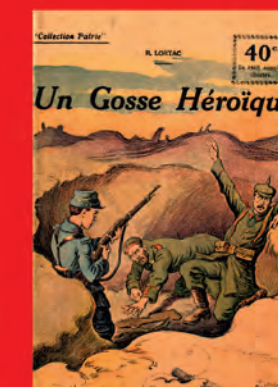
Un gosse héroïque, par Robert Lortac, collection Patrie, n° 47, 1917. Collection Archives départementales de l'Isère

Tarif : 10 € - Gratuit pour les moins de 15 ans