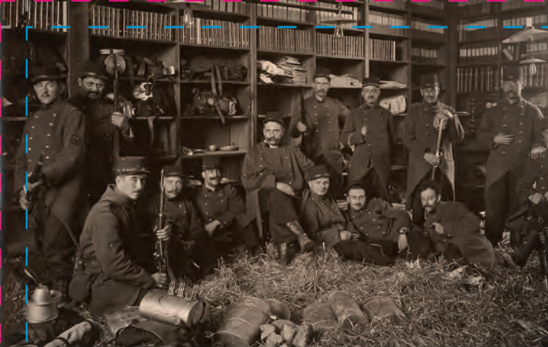
Occupation de la bibliothèque de l'École de médecine de Grenoble par la section télégraphique du 4 e Génie, août 1914.