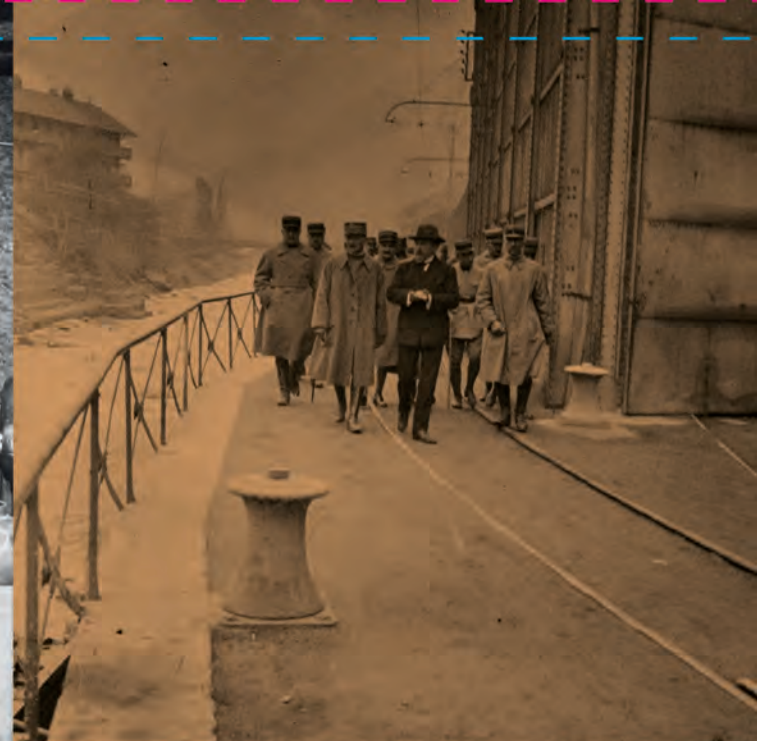
Albert Thomas visitant l'usine de Livet des établissements Keller et Leleux, photographie prise par la famille Keller, Livet-et-Gavet (Isère), 11 août 1916.